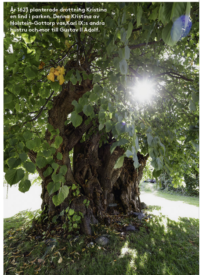
År 1623 planterade drottning Kristina en lind i parken. Denna Kristina av Holstein-Gottorp var Karl IX:s andra hustru och mor till Gustav II Adolf.