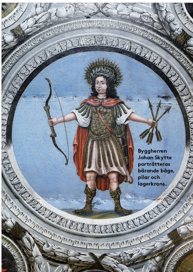
Byggherren Johan Skytte porträtteras bärande båge, pilar och lagerkrans.