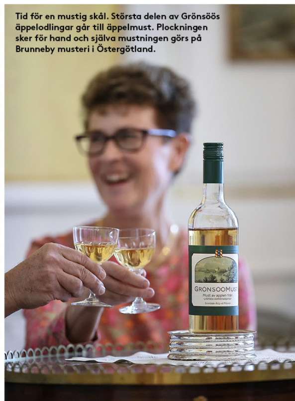
Tid för en mustig skål. Största delen av Grönsöös äppelodlingar går till äppelmust. Plockningen sker för hand och själva mustningen görs på Brunneby mustereri i Östergötland.