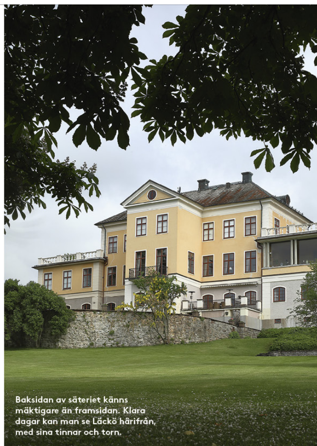
Baksidan av säteriet känns mäktigare än framsidan. Klara dagar kan man se Läckö härifrån, med sina tinnar och torn.

Fasaden på godset har en puts som lyser ockragult med en grusad plan framför. Den första stenbyggnaden fanns på plats under 1500-talet, men efter en brand år 1698 byggdes ett nytt corps-de-logi som var klart 1707. >