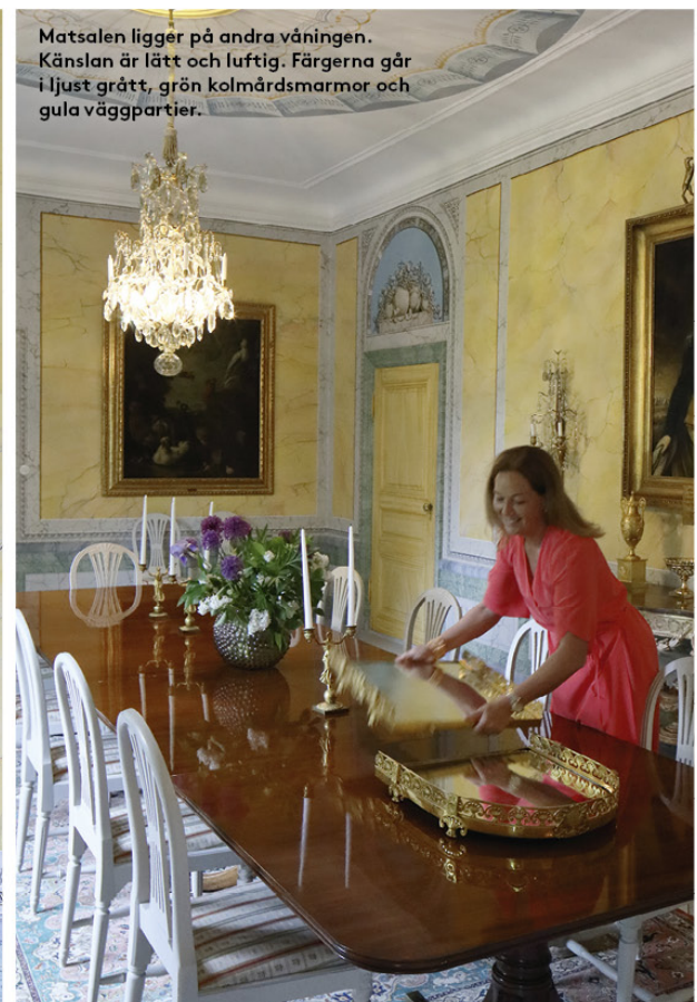
Matsalen ligger på andra våningen. Känslan är lätt och luftig. Färgerna går i ljus grått, grön kolmårdsmarmor och gula väggpartier.