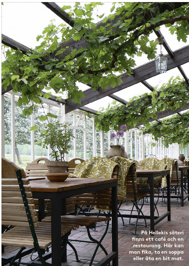
På Hellekis säteri finns ett café och en restaurang. Här kan man fika, ta en soppa eller äta en bit mat.