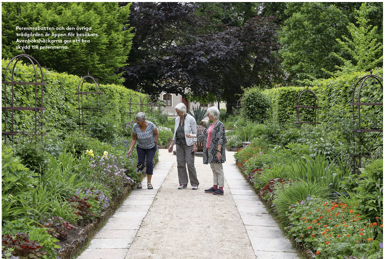
Perennrabatten och den övriga trädgården är öppen för besökare. Avenbökshäckarna ger ett bra skydd till perennerna.