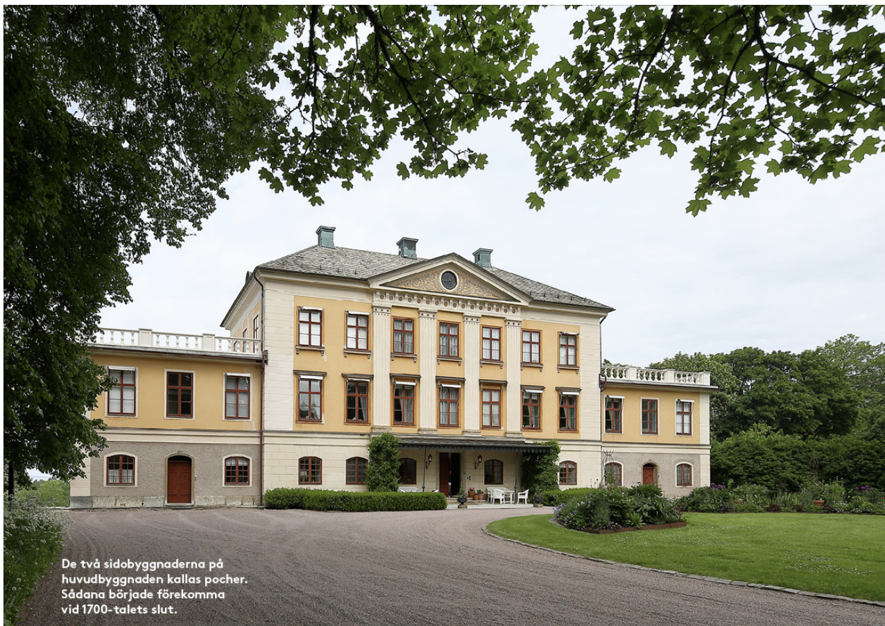
De två sidobyggnaderna på huvudbyggnaden kallas pocher. Sådana började förekomma vid 1700-talets slut.