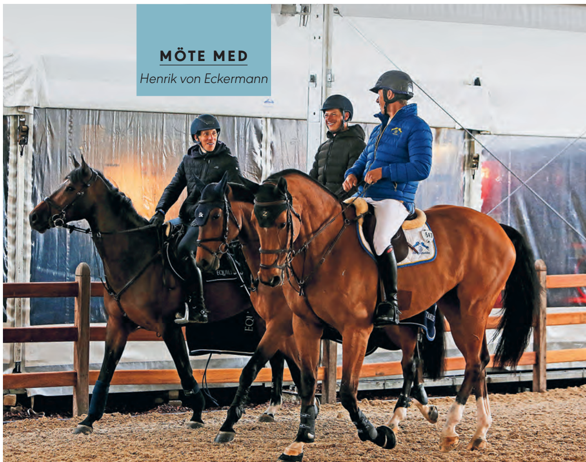
Skritt och skratt på framridningen i Antwerpen, här tillsammans med Daniel Deusser och ytterst Christian Ahlmann.

"Det finns alltid saker att förbättra. Jag försöker se varje tävling som ett nytt tillfälle att lära mig saker."