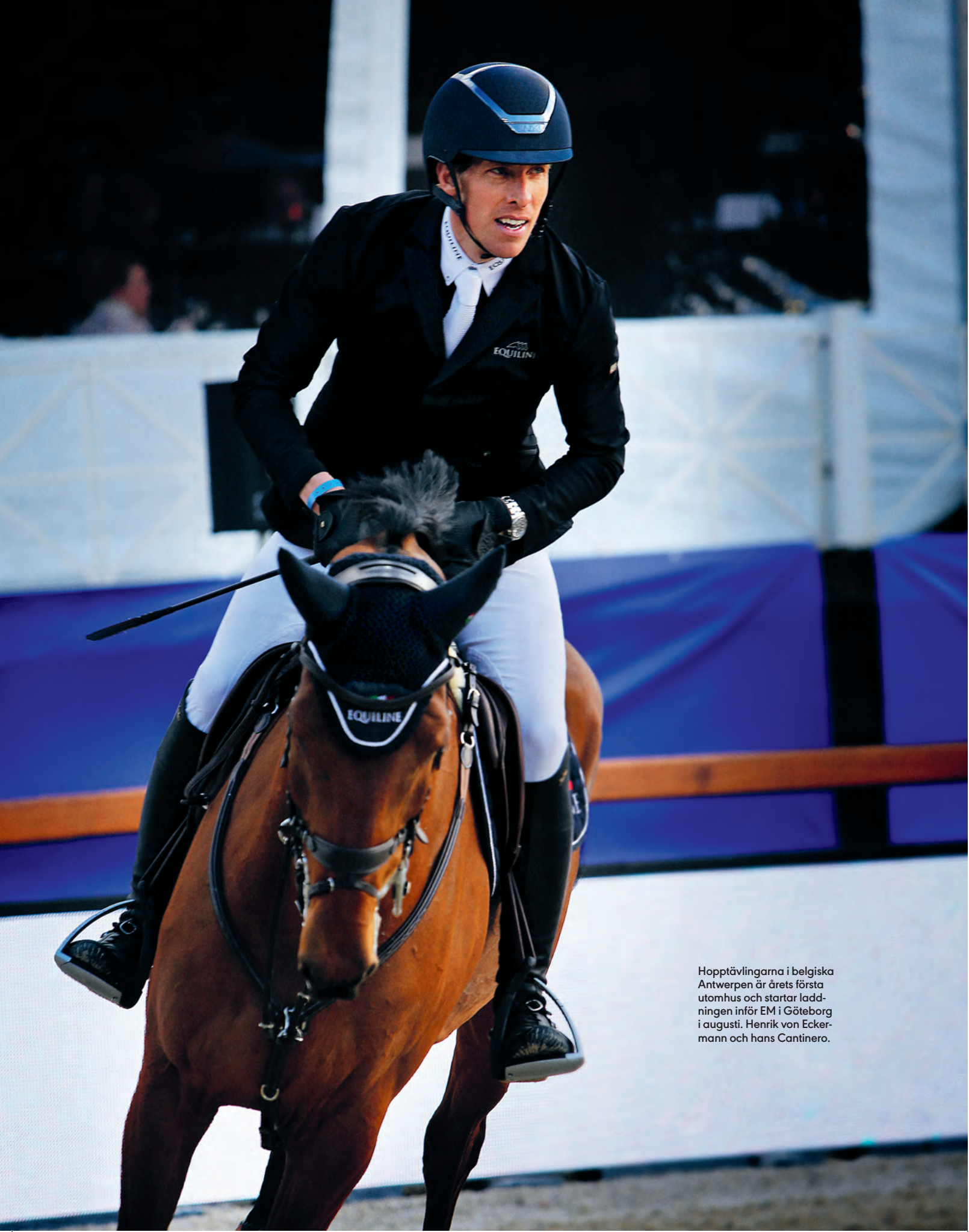
Hopptävlingarna i belgiska Antwerpen är årets första utomhus och startar laddningen inför EM i Göteborg i augusti. Henrik von Eckermann och hans Cantinero.