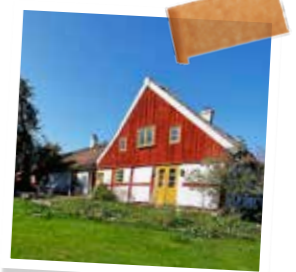
Skånelången är en gammal prästgård där prästen höll söndagsskola i vardagsrummet.

– Jag gillar inte alltför moderna saker som sjösten och bubbelbadkar.