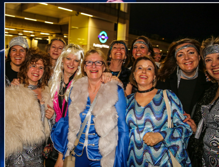
Glitter och glamour var det som gällde när det här glada gänget besökte ABBA Voyage .

som turist att släppa kontrollen och hänga med på en ordnad resa. Slip-pa störningar på tunnelbanan och bara få en biljett i handen. Och det är precis vad de 25 gäster som ska gå på ABBA Voyage har gjort.