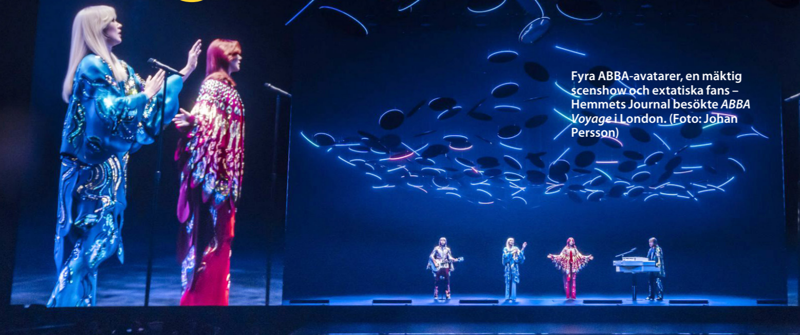
Fyra ABBA-avatarer, en mäktig scenshow och extatiska fans – Hemmets Journal besökte ABBA Voyage i London.

ABBA Voyage har hyllats som ett av de mest nyskapande greppen inom live-musik. HJ följde med till London och fick se fyra digitala kopior som var skrämmande lika Agneta, Björn, Benny och Frida. Men visst skapade de feststämning i den sprängfyllda arenan!