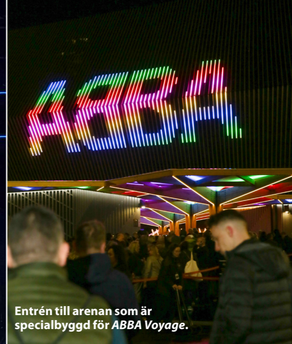
Entrén till arenan som är specialbyggd för ABBA Voyage .